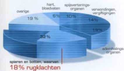
Indeling van ziektedagen naar de belangrijkste ziektebeelden